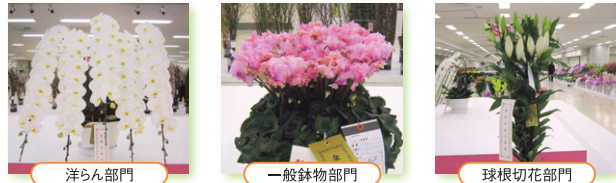
洋らん部門 一般鉢物部門 球根切花部門