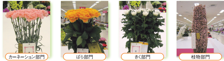
カーネーション部門 ばら部門 きく部門 枝物部門