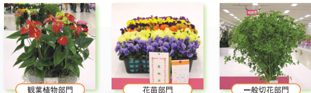
観葉植物部門 花苗部門 一般切花部門