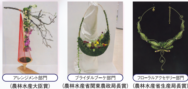
アレンジメント部門 (農林水産大臣賞) プライダブルブーケ部門 (農林水産省関東農政局長賞) フローラルアクセサリ部門 (農林水産省生産局長賞)